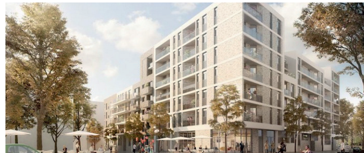
Neue Mitte Altona, Hamburg Block 2-5 Altona u. BVE Wettbewerbsbetreuung / Quartiersentwicklung D&K Drost Consult und Altona & BVE