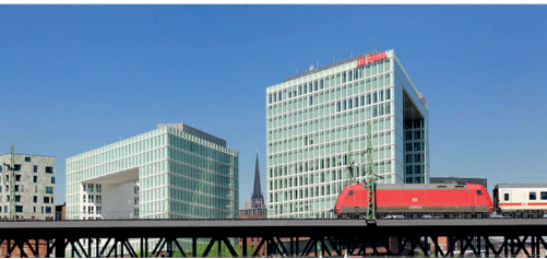
SPIEGEL Verlagshaus Bauleitung Innenausbau mit KAEFER Construction , Henning Larsen Architects

Ich stehe für einen gemeinsamen Ruderschlag, mit allen am Bau beteiligten Personen. Die Eckpfeiler aus Zeit- und Kostenplanung, Qualitäten, Abstimmung und Kommunikation, bilden das Fundament meiner Arbeit. Zufriedenheit, Zeit und Kostenersparnis sind mein Anspruch für Ihr Bauvorhaben.