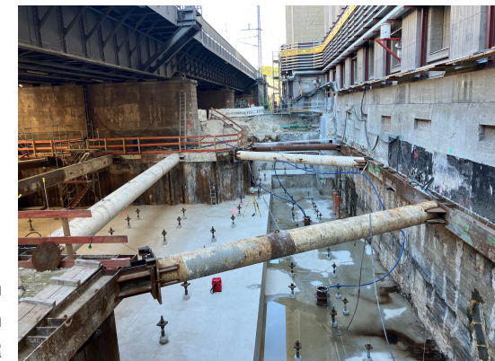
Museumsinsel Berlin mit Kemmermann Projektmanagement und BBR